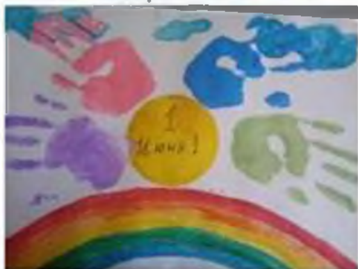
Название работы: -Мир глазами детей-