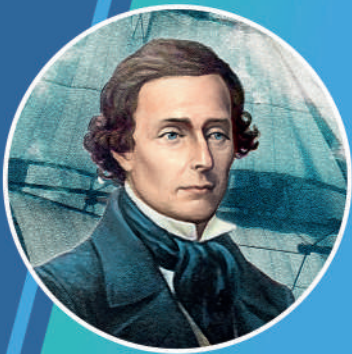
В. И. ДАЛЬ