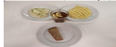
Обед (12 лет и старше)