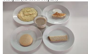
Льготное питание (12 лет и старше)