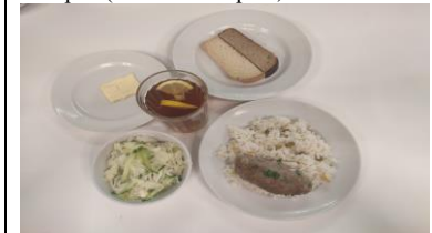
Обед (12 лет и старше)