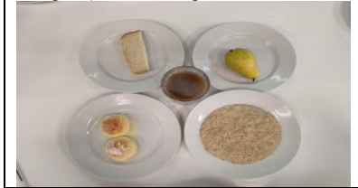
Обед (12 лет и старше)