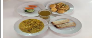
Льготное питание 2 смена (7-11 лет) полдник