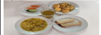
Льготное питание 2 смена (12 лет и старше), полдник