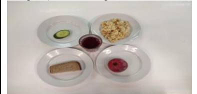
Обед (12 лет и старше)