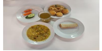
СД Льготное питание 1 смена (12 лет и старше) обед