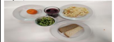
СД Льготное питание 1 смена (12 лет и старше) завтрак