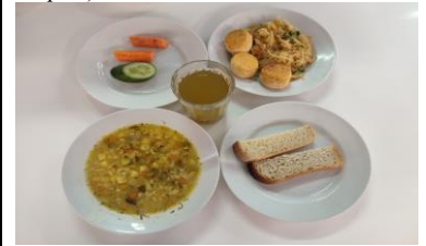
Льготное питание 2 смена (12 лет и старше) обед