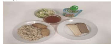
Льготное питание 1 смена (12 лет и старше) завтрак