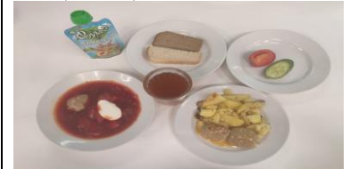
Бесплатное питание (12 лет и старше)