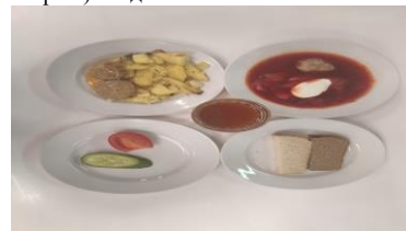
Льготное питание 2 смена (12 лет и старше) обед