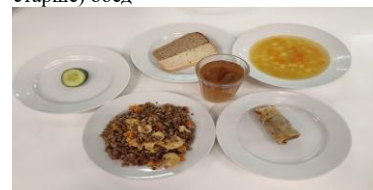
Льготное питание 2 смена (12 лет и старше) обед