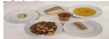
Льготное питание 2 смена (12 лет и старше), подник