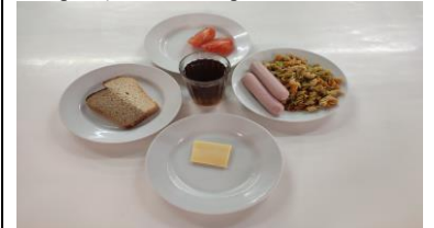
Обед (12 лет и старше)