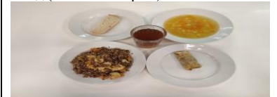
Бесплатное питание (12 лет и старше)