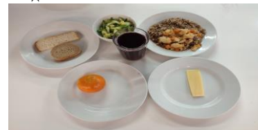
Льготное питание 1 смена (12 лет и старше) завтрак