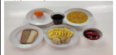
Бесплатное питание (12 лет и старше)