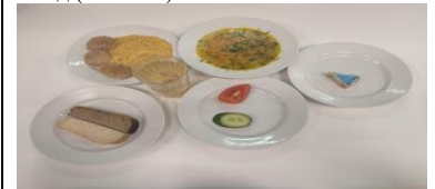
Бесплатное питание (12 лет и старше)