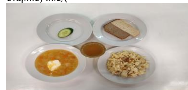
Льготное питание 2 смена (12 лет и старше) обед