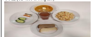
Бесплатное питание (12 лет и старше)