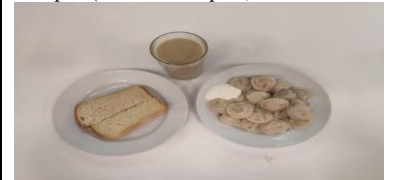
Обед (12 лет и старше)