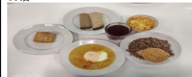
Льготное питание 2 смена (7-11 лет) обед