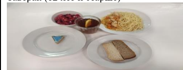
Льготное питание 1 смена (7-11 лет) завтрак