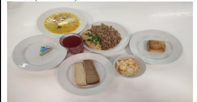
Бесплатное питание (12 лет и старше)