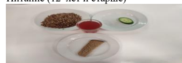
Льготное питание (12 лет и старше)