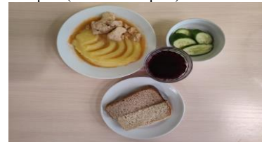
Питание (12 лет и старше)