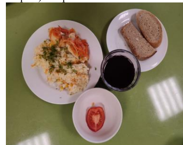
СД Льготное питание 2 смена (12 лет и старше) обед