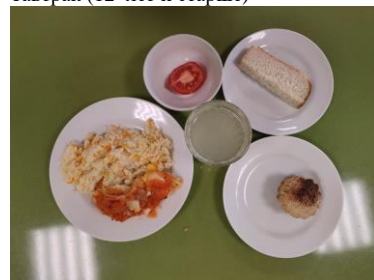
Обед (12 лет и старше)