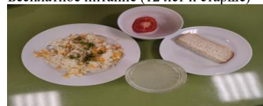
Льготное питание I смена (12 лет и старше) завтрак