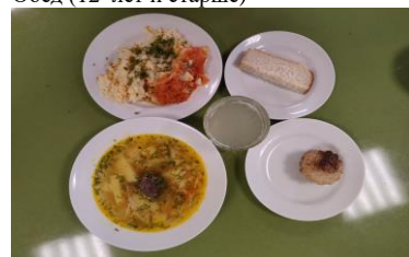
Бесплатное питание (12 лет и старше)