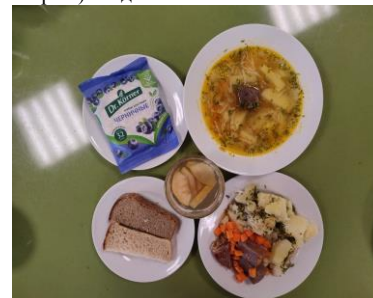
СД Льготное питание 2 смена (12 лет и старше) обед