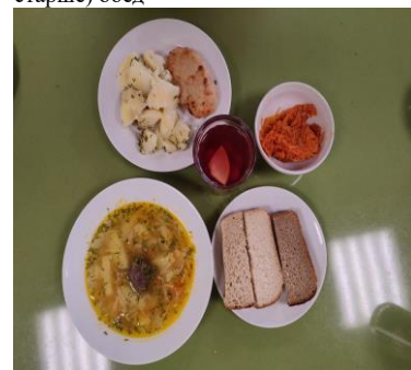
Льготное питание 2 смена (12 лет и старше), обед