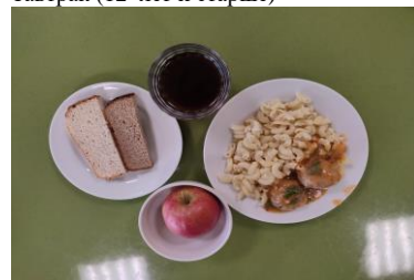
Обед (12 лет и старше)