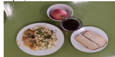
СД Льготное питание 1 смена (12 лет и старше) завтрак