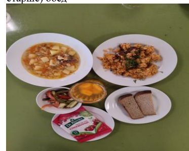
СД Льготное питание 2 смена (12 лет и старше) обед