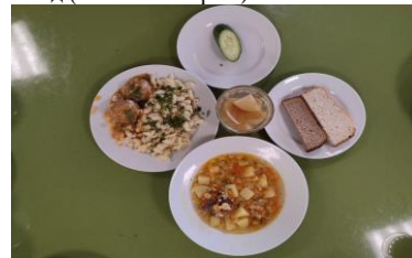
Бесплатное питание (12 лет и старше)