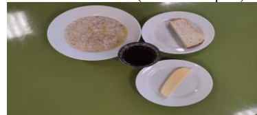
Льготное питание I смена (12 лет и старше) завтрак