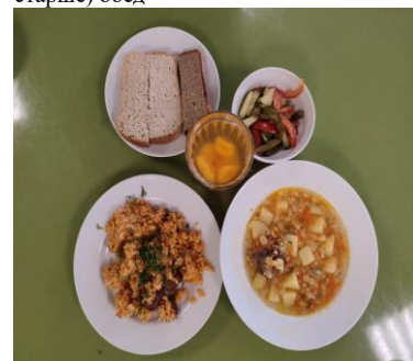
Льготное питание 2 смена (12 лет и старше), обед