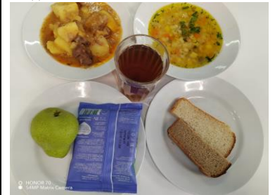
СД Льготное питание 2 смена (7-11 лет) обед