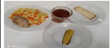
СД Льготное питание 1 смена (12 лет и старше) завтрак