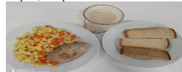
Льготное питание 1 смена (12 лет и старше) обед