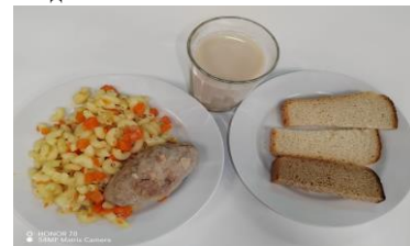
Льготное питание 1 смена (12 лет и старше) завтрак