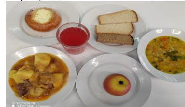
СД Льготное питание 1 смена (7-11 лет) завтрак