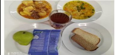
СД Льготное питание 2 смена (7-11 лет) полдник