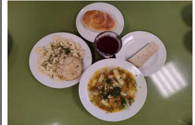
Бесплатное питание (12 лет и старше)