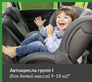
Автокресла групп I (для детей массой 9–18 кг)*